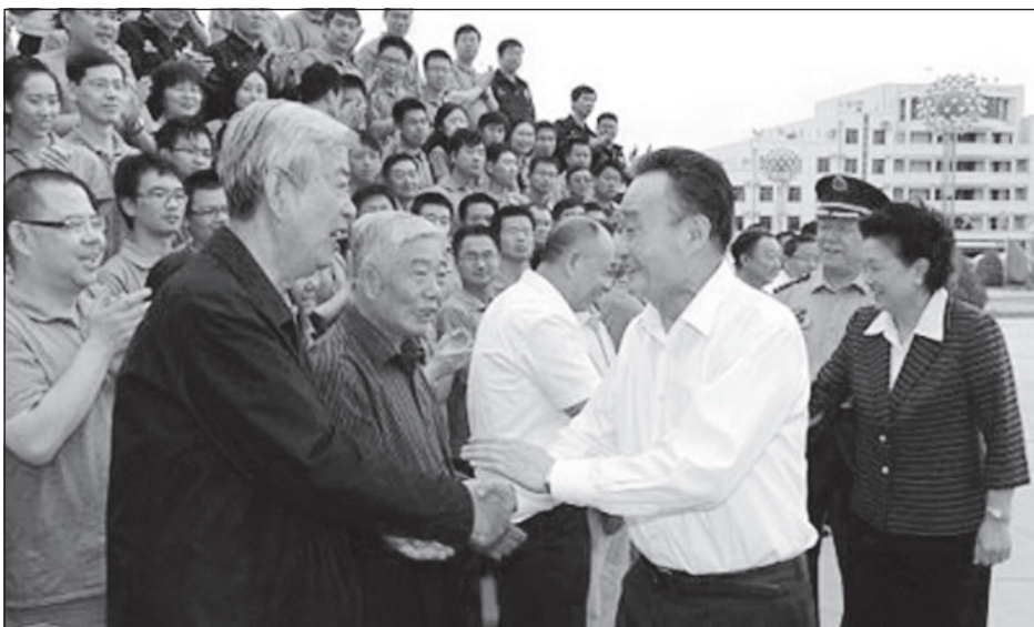
У Банго поздравява специалистите, подготвили полета